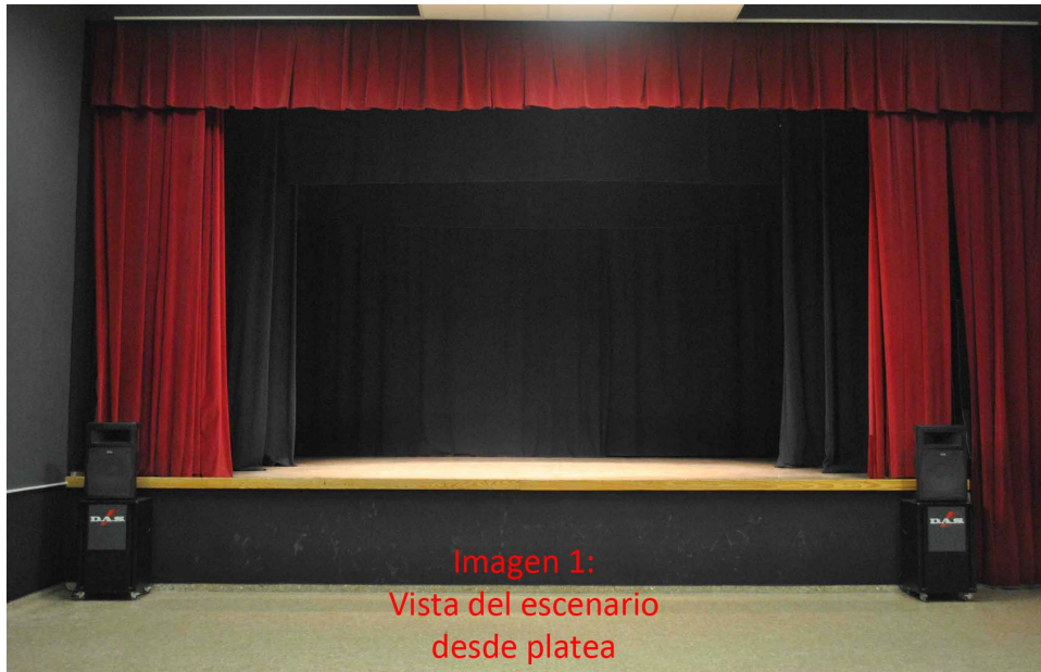
Imagen 1: Vista del escenario desde platea