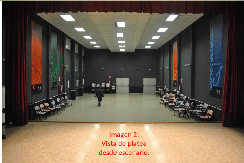
Imagen 2: Vista de platea desde escenario.