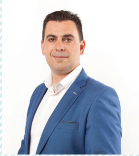
Toni Subiela Chico Ciudadanos