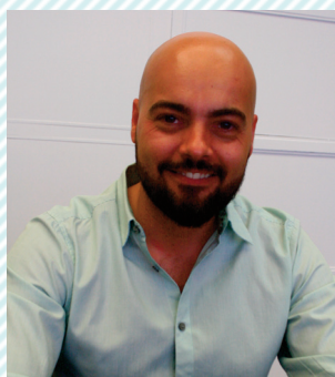
Manuel Lozano Relaño Partido Socialista (PSPV-PSOE)