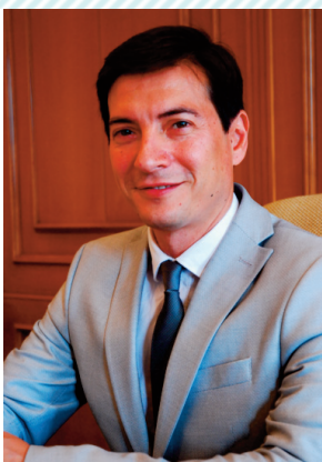
Rafa Garc3a Garc3a Alcalde de Burjassot