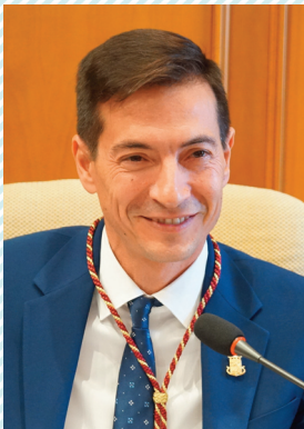
Rafa García García Alcalde de Burjassot