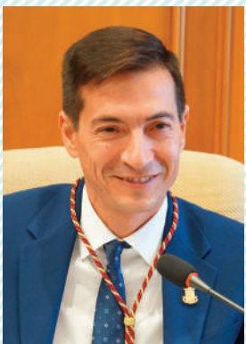
Rafa Garc3a Garc3a Alcalde de Burjassot